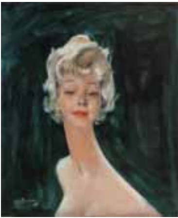
69. Jean-Gabriel DOMERGUE