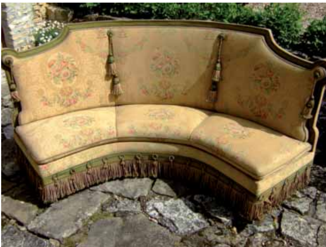
Banquette d'angle capitonnée de tapisserie mécanique à décor floral et belle passementerie Epoque Napoléon III Larg. 233 cm