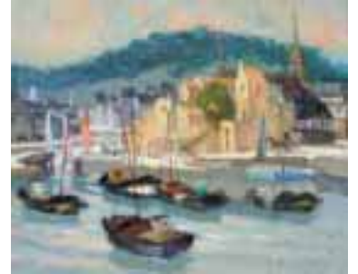
30. Pierre BOUDET