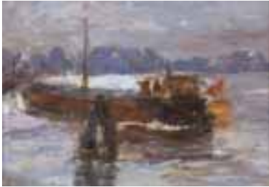
28. Maurice VAUMOUSSE