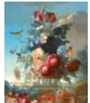
81. Ecole Française XX e siècle