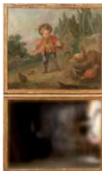
Trumeau surmonté d'une huile sur toile «Enfant dans la basse cour» Fin XVIII e siècle Haut 132 cm - Larg 86 cm.