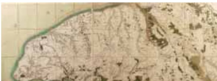
Rare carte d'état-major de Haute Normandie polychromée, datée 1767 – 160 x 60 cm.