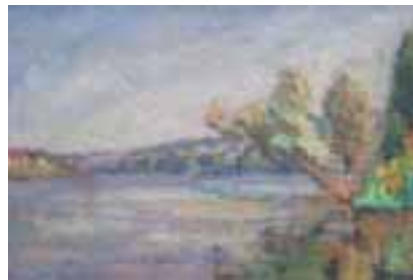
56. Abel LAUVRAY