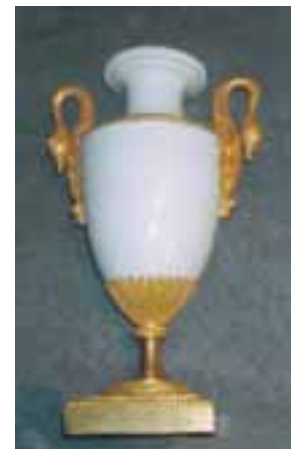
Belle paire de vases à l'Antique en porcelaine de Loqué, piédouche en bronze ciselé et doré, anses à col de cygnes Epoque Empire Haut 28 cm - Larg 17 cm.