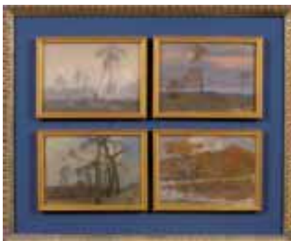
58. Gaston SIMOES de FONSECA