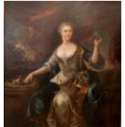
94. Attribué à François DE TROY