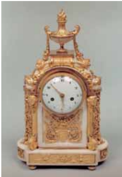
Rare pendule-borne en marbre blanc et bronze ciselé et doré à décor de corbeille de fruits, têtes de femmes laurées, pot à feu et bas-reliefs à l'Antique, cadran signé «Jacob à Paris» Epoque Louis XVI Haut 43,5 cm - Larg : 25,5 cm.