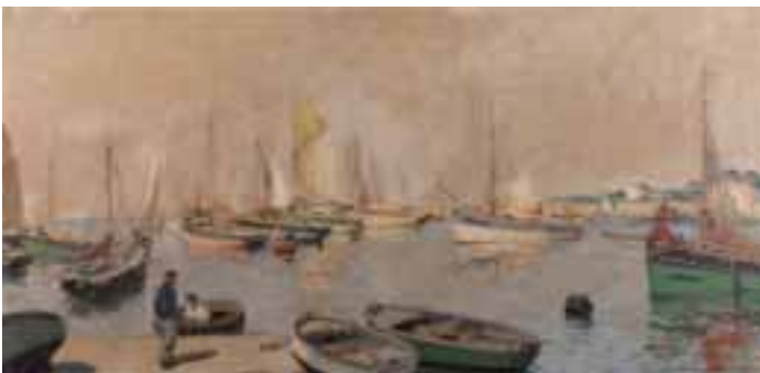
54. Paul-Emile LECOMTE