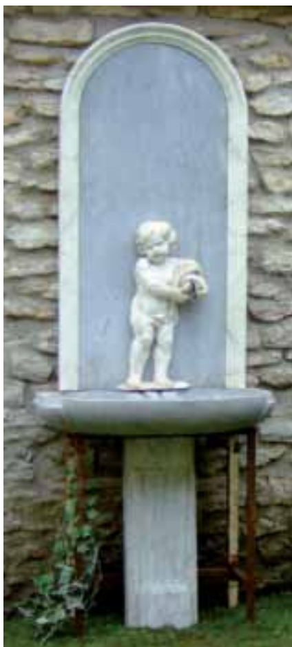
Fontaine de fond de parc en marbres gris et blanc : «Putti au vase» Arcature en bois peint façon marbre Vers 1900 Haut. 235 cm - Larg. 96 cm