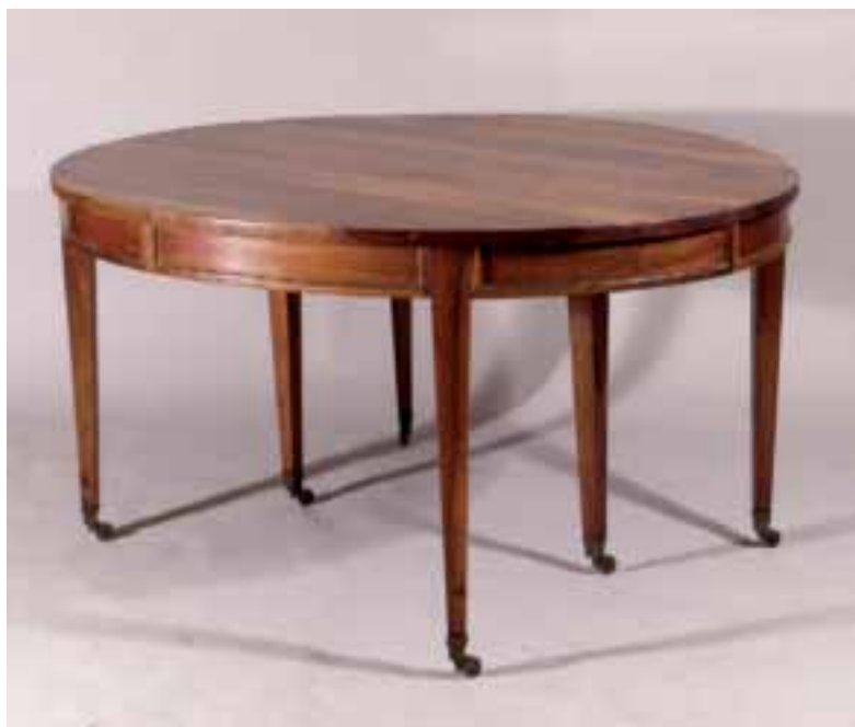
Table de salle à manger à bandeau en noyer mouluré de cuivres, six pieds gaine à roulettes Début XIX e siècle Haut. 127 cm - Larg. 144 cm (5 allonges).