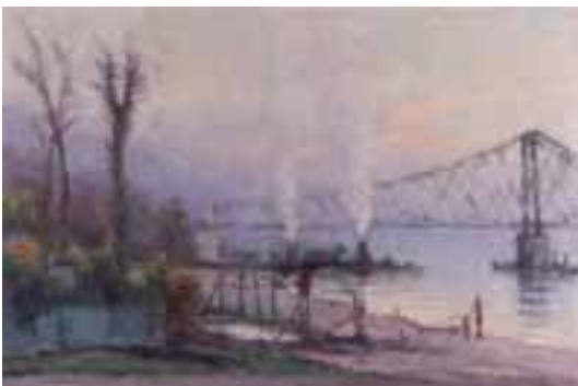
39. Narcisse HENOCQUE