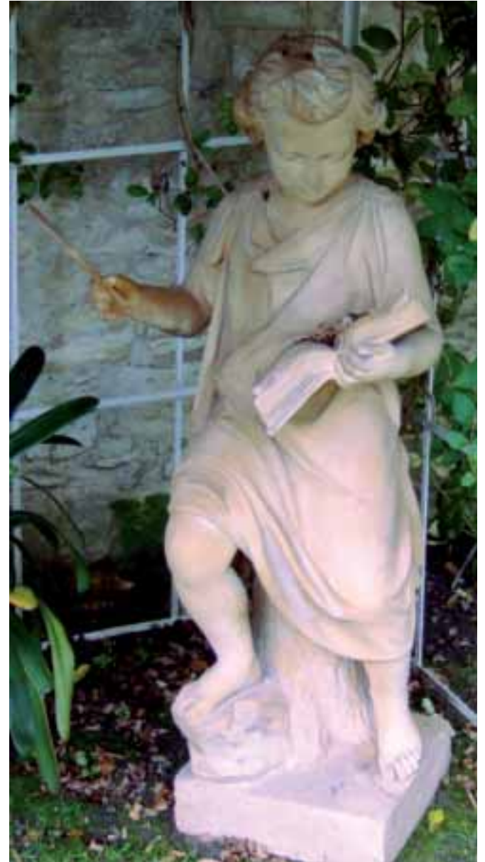
Statue en terre cuite «Jeune page studieux lisant» Fin XIX e siècle Haut. 117 cm