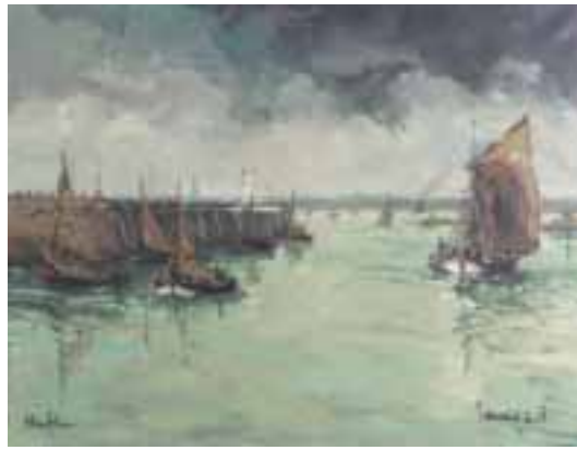
53. L.-P. LAVOINE