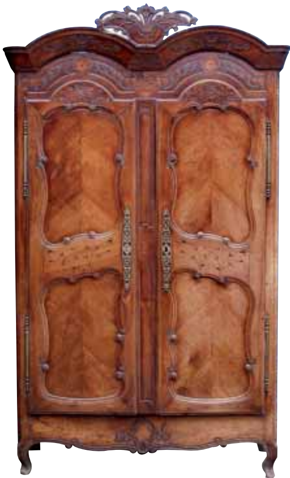
Armoire en merisier et placage de merisier marqueté de fleurs Porte l'inscription «Fait par moi Gruel, l'an 1827» Région de Rennes Haut. 250 cm – Larg. 110 cm – Prof. 65 cm.