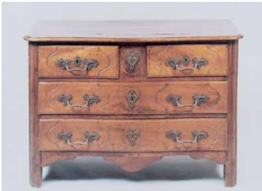
Commode en noyer mouluré à trois rangs de tiroirs Ile-de-France - XVIII e siècle Haut. 80 cm - Larg. 110 cm - Prof. 62 cm.