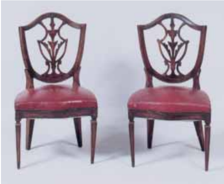
Suite de six chaises en acajou, à dossier écusson ajouré Angleterre, fin XVIII e siècle