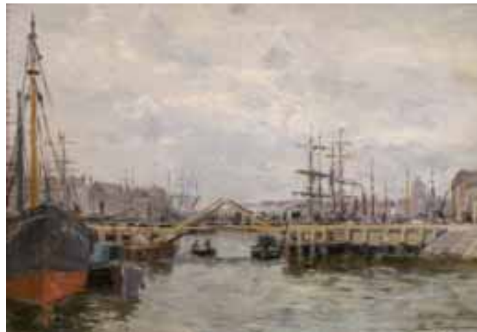
67. Hippolyte PETITJEAN