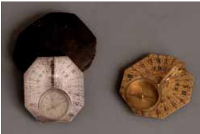
Cadran solaire de Butterfield, un en argent début XVIII e siècle, l'autre en laiton gravé XVIII e siècle.

et saucière barquette en argent de forme contournée, ciselée de rocailles, et agrafes feuillagées et gravée de doubles armoiries princières, avec sa doublure en argent – Style Louis XV – Travail de E. Cardeilhac – Poids 1.283 g.