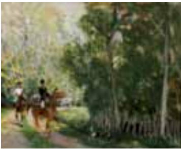
64. Jules-René HERVÉ