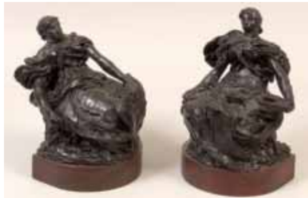
102. Théodore RIVIÈRE