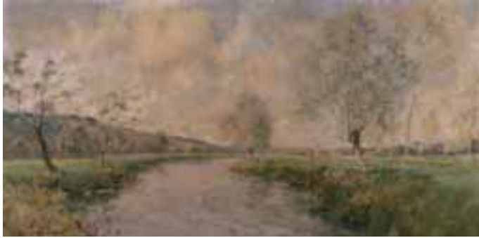
55. Paul-Emile LECOMTE