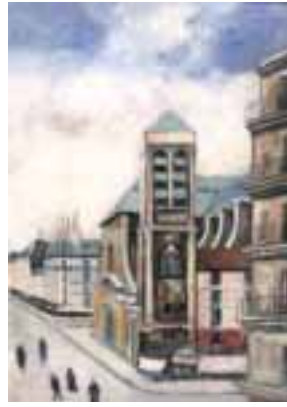
72. Elisée MACLET