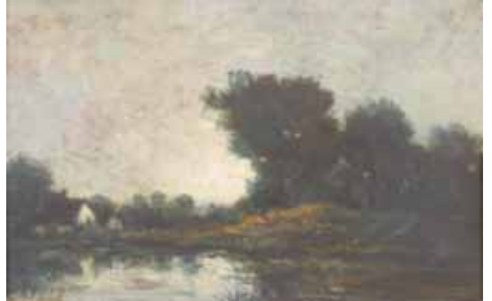
87. Charles-François DAUBIGNY