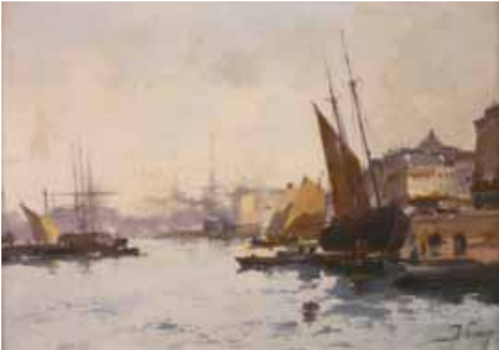
85. Eugène GALIEN-LALOUÉ