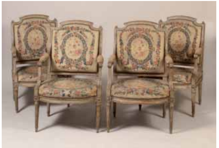
Suite de 4 fauteuils à dossier plat en bois laqué et sculpté Estampillés de F.R.C. Reuze, reçu Maître en 1743 Epoque Louis XVI Garniture de tapisserie aux petits points Larg. 54 cm