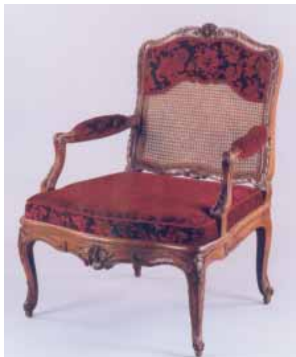
Superbe fauteuil canné en noyer naturel richement sculpté de rinceaux et grenades éclatées Epoque Régence Larg. 80 cm.