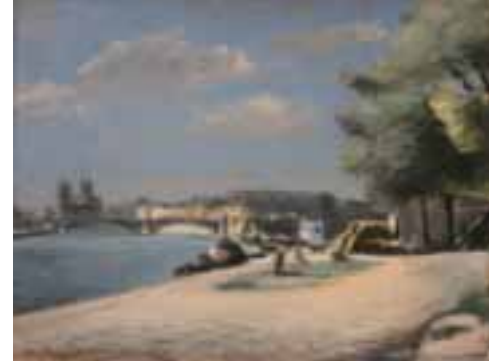
62. René HAYDEN