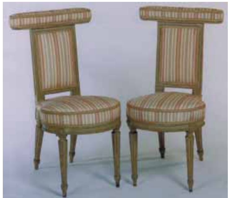
Paire de chaises voyeuses à dossier plat en bois laqué, mouluré, sculpté Epoque Louis XVI Larg. 66 cm.