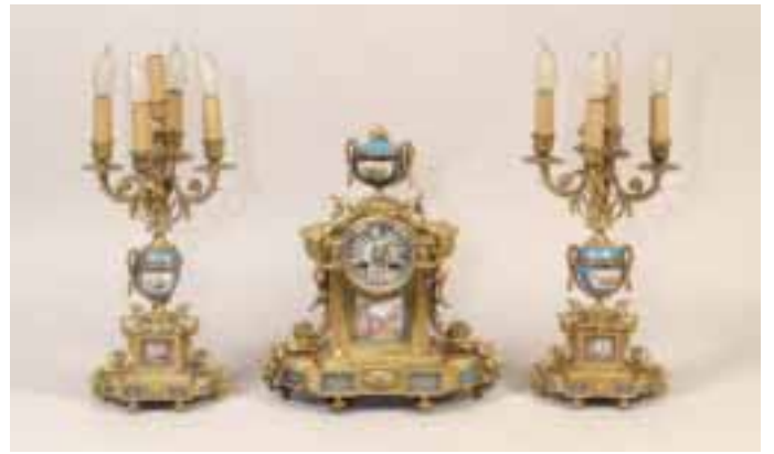
Garniture en bronze doré et plaques de porcelaine : pendule et paire de candélabres Style Louis XVI, Fin XIX e siècle Pendule Haut 40 cm - Larg 35 cm Candélabres Haut 50 cm.