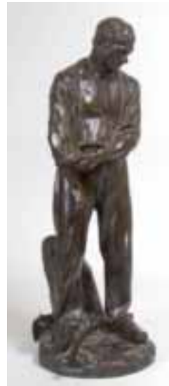
101. Jules DALOUE