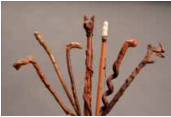
Collection de cannes monoxyle en bois naturel sculpté et jonc de Malacca XIX e siècle.