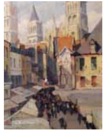
44. Louis VIGON