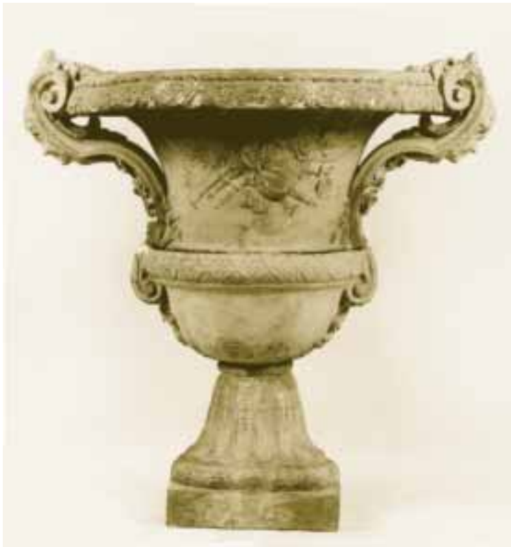
D'après François GIRARDON (1628-1715) Vase orné de trophées d'instruments de musique, en terre cuite Haut 150 cm - Diam 120 cm (accidents et restaurations) Modèle original conservé au Musée du Louvre