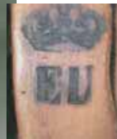
Rare suite de quatre fauteuils à dossier cabriolet en hêtre naturel, mouluré et sculpté Estampillés de Jean-Baptiste Boulard, reçu maître en 1755, et de la marque au feu du château d'Eu sous une couronne royale Epoque Louis XV

Provenance : collection de Louis-Philippe II d'Orléans (Paris, 1773 - Clermont, Angleterre, 1850), Roi des français sous le nom de Louis-Philippe I er (1830-1848), au château d'Eu, Seine-Maritime