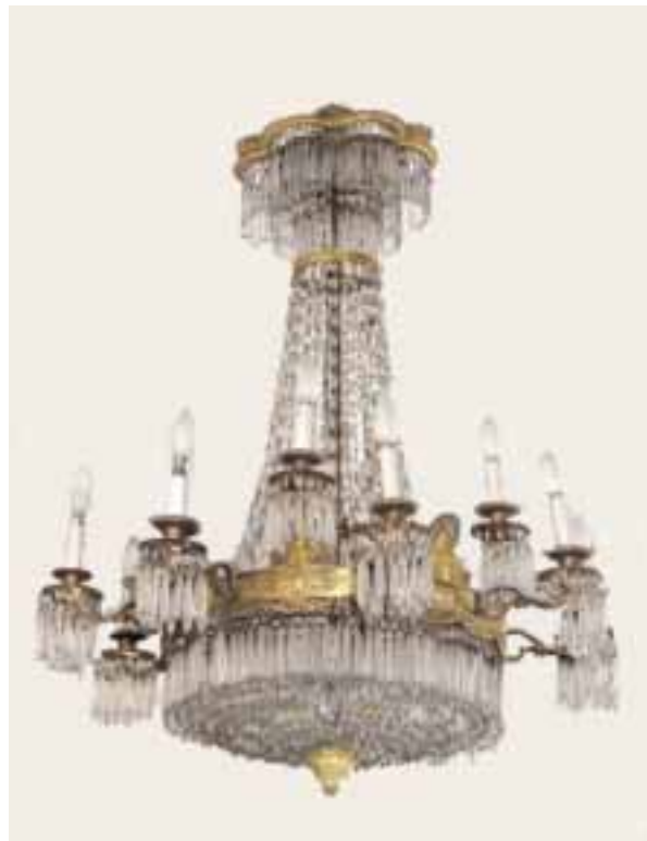
Lustre corbeille à enfilages de cristaux et pampilles, couronnes en bronze ciselé et doré à douze bras de lumières Epoque Restauration Haut 105 cm - Diam 83 cm.