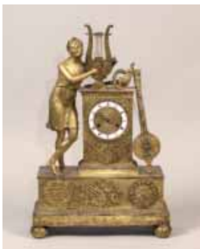
PENDULE en bronze ciselé et doré «Le Musicien» Epoque Restauration Haut 57 cm - Larg 35 cm.