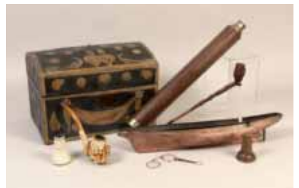
Collection d'art populaire : malles Normandes, lunette de marine, microscope d'entomologiste, pipes, nécessaire à œufs en ivoire de la maison Hermès, dents de cachalot, marque à pain en forme d'ostensoir, tabatières, ivoires de Dieppe, etc.