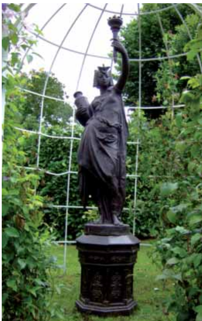
Importante porte torchère en fonte de fer patiné : «Egyptienne au vase», sur son socle Haut. 223 cm