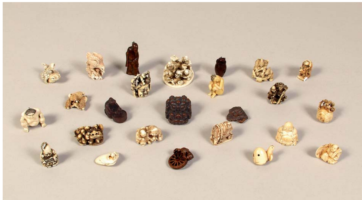
Belle collection de NETSUKÉ en ivoire et buis, Japon XVIIIe et XIXe siècle beaucoup signés et certains référencés : GIONEN SHICHI JUNI SHURAKU, GUYOKUZAN, IKKOSAI, KOGYOKU, KORIN, MASANAO, MAZAKAZU, MASATSUGU, MITSUHARU, RYUGYOKU, TOMOTADA, ...