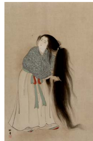
CHODO "Jeune femme démêlant sa chevelure". Japon, fin XIXe