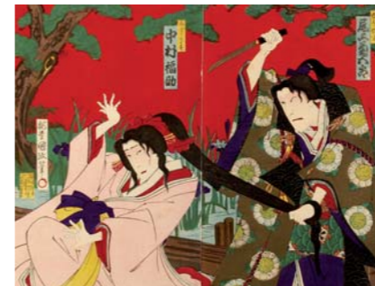
ECOLE D'UTAGAWA "Deux acteurs dans des rôles féminins jouant une scène de Kabuki" Diptyque, Japon. XIXe