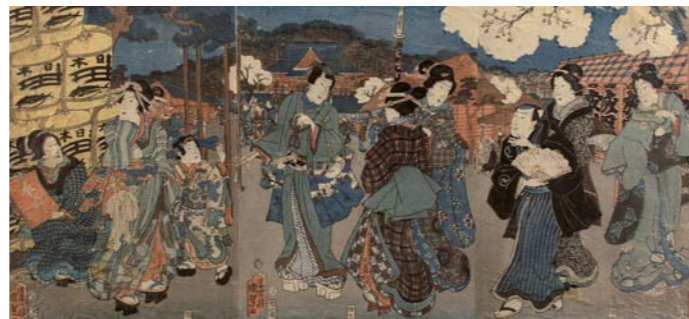
TOYOKUNI "le prince Genji accueilli à l'entrée des Maisons Vertes" Triptyque, Japon. XIXe