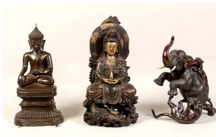
BOUDHA assis sur un padma en bronze patiné Birmanie, fin XIXe siècle (H. 53 cm)