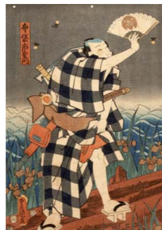
TOYOKUNI "Samurâi chassant des lucioles à l'aide de son sensu", édité par TSUTAYA, circa 1855