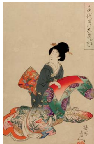
CHIKANOBU "Jeune femme tenant un futon richement décoré. Japon

En page de couverture : En fond : PEINTURE MINÉRALE YAO (détails d'une partie de série) utilisée lors de cérémonies taoïstes. Chine du sud, XIXe siècle. Au premier plan : bel OKIMONO en ivoire, buis et bois de rose "bûcheron portant un fagot en équilibre sur un tronc d'arbre", signé, Japon, XIXe siècle. Haut. 27,5 cm - Larg. 29 cm