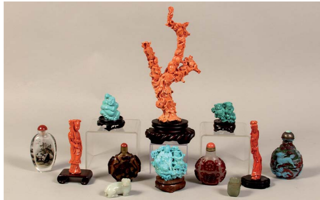
CORAUX rouge dont statuette à trois digitations "princesse impériale tenant un Ushiwa avec des enfants" Chine (H. 30 cm) et "princesses" (H. 15 cm et H. 14 cm) TURQUOISES, TABATIÈRES en verre de Pékin, cristal, ivoire ...