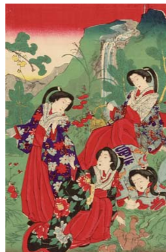
CHIKANOBU "Jeunes femmes cueillant des champignons" Japon, fin XIXe