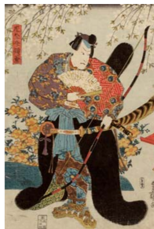
TOYOKUNI "Samurâi armé de ses tachi, wakisachi et arc" Japon, XIXe